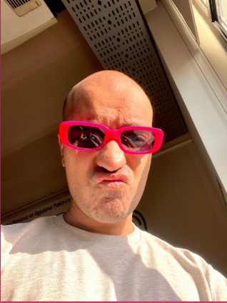
Yalım Cinisli Creative